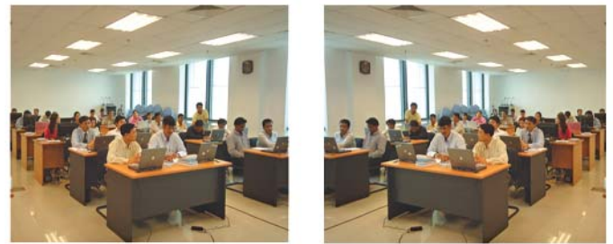
សកម្មភាពវគ្គបណ្តុះបណ្តាលស្តីពី ការកែលម្អ ការផ្តល់សេវាសាធារណៈ

ការផ្តល់សេវាសាធារណៈប្រកបដោយគុណភាព គឺជាឧបករណ៍ដ៏សំខាន់មិនអាចធ្វេសប្រហែស ឬមើលរំលង បានដែលត្រូវតែផ្តោតការយកចិត្តទុកដាក់ខ្ពស់ក្នុងការ អនុវត្តគ្រប់វិស័យនៅទូទាំងប្រទេស ស្របទៅតាមទឹកដីនៃ ពេលវេលា និងតម្រូវការរបស់ប្រជាពលរដ្ឋ ដើម្បីឈាន ទៅសម្រេចបានគោលដៅអភិវឌ្ឍន៍សហស្សវត្សកម្ពុជា និង ការកាត់បន្ថយភាពក្រីក្រ។