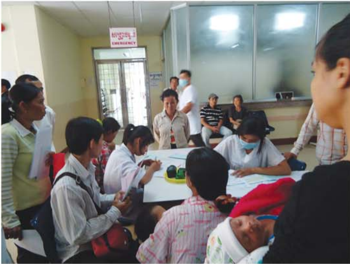
សកម្មភាពប្រជាពលរដ្ឋមកទទួលយកសេវាពិនិត្យសុខភាពកុមារ នៅមន្ទីរពេទ្យកុមារជាតិ