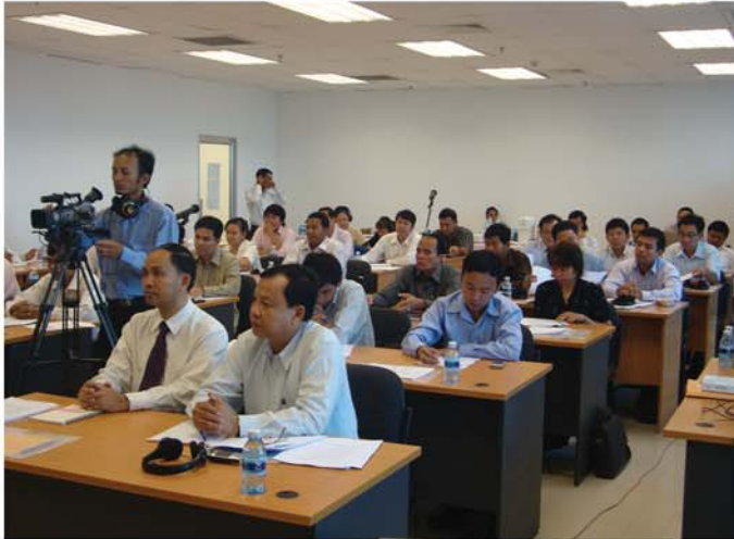
សកម្មភាពសិក្ខាសាលាក្រោមគម្រោងស្តីពី ការអភិវឌ្ឍសមត្ថភាពមន្ត្រីរាជការ