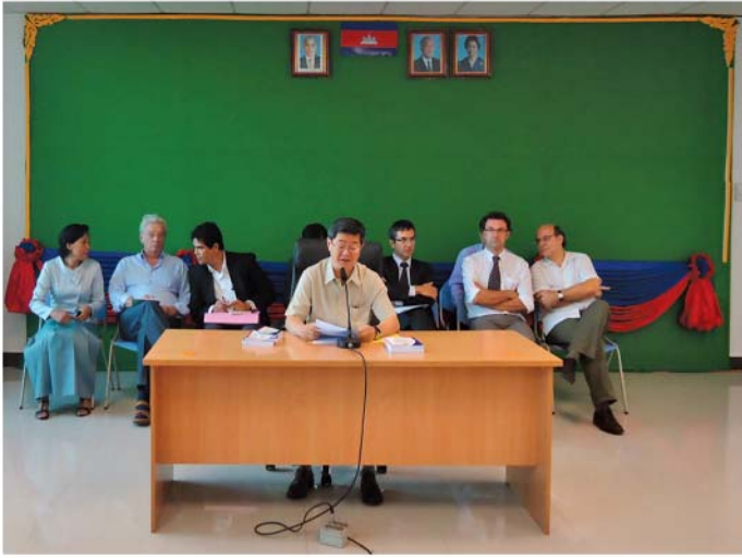
ឯកឧត្តម ង៉ៅ ហុងលី អគ្គលេខាធិការ ក្រុមប្រឹក្សាកំណែទម្រង់ រដ្ឋបាល ជាអធិបតីក្នុងពិធីបើកវគ្គបណ្តុះបណ្តាលស្តីពី ការកែលម្អការផ្តល់សេវាសាធារណៈ