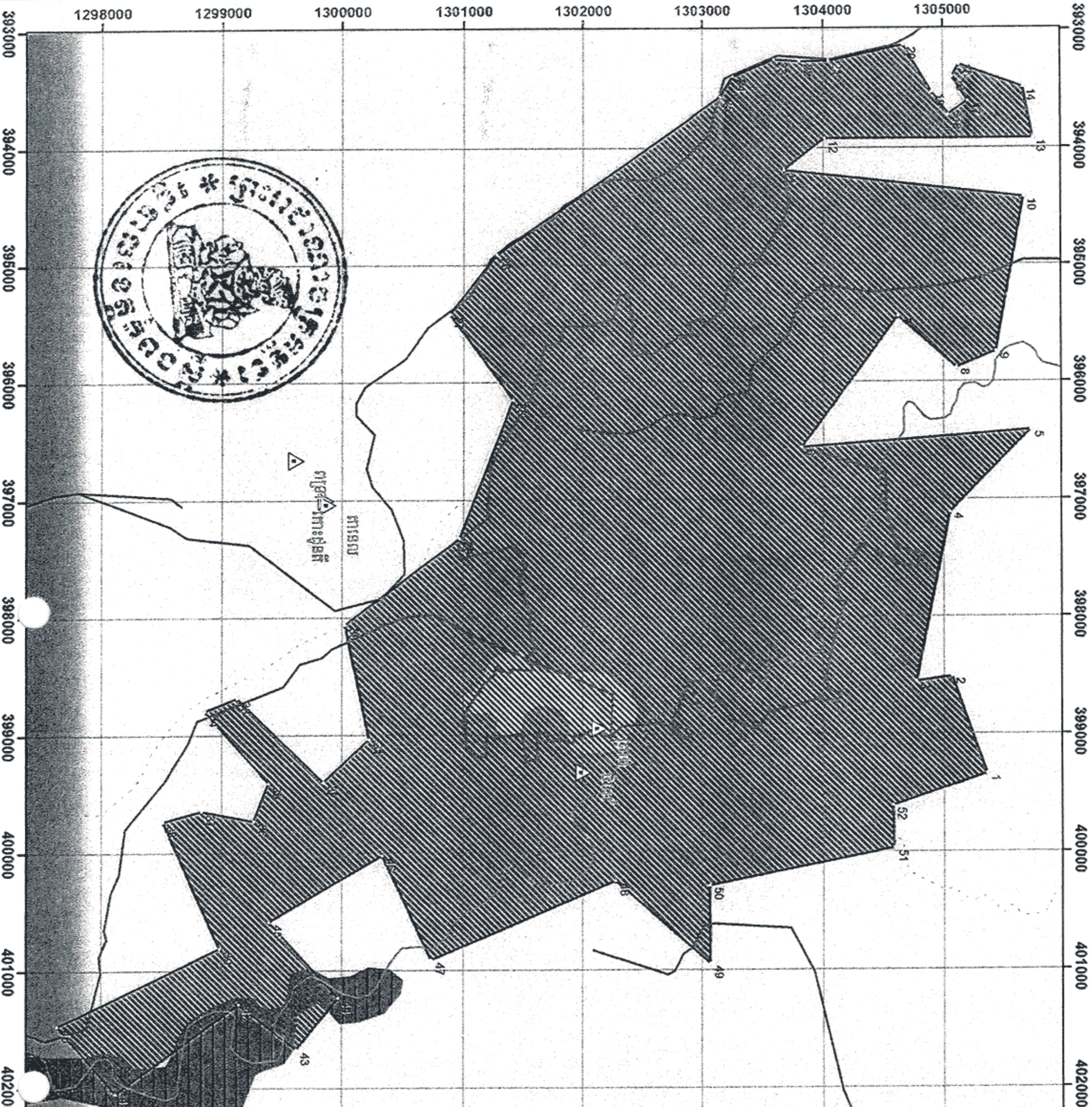
តារាងចំណុចកំណត់ដី

១ ភូមិស្រែវែង ក្រុងសៀមរាប ខេត្តសៀមរាប មានចំណុចកំណត់ដូចខាងក្រោម៖