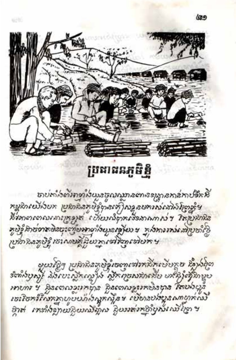
ទំព័រមួយនៅក្នុងសៀវភៅពុម្ពរបស់ខ្មែរក្រហម ដែលបង្ហាញពីកងធ្វើចម្រងរបស់ខ្មែរក្រហមនៅក្នុងទសវត្សរ៍ឆ្នាំ១៩៨០។

ការណែនាំ៖ ចូរបិទសៀវភៅចំណាយពេលមួយនាទីដើម្បីគិតអំពីសាច់រឿងដែលអ្នកអាចចាំបាន។ សូមធ្វើការជាមួយដៃគូម្នាក់រៀបរាប់សាច់រឿងឡើងវិញយ៉ាងហោចណាស់ឲ្យបានចំនួនមួយ។ ដៃគូរបស់អ្នកត្រូវបើកសៀវភៅ កត់ត្រាផ្នែកនៃសាច់រឿងដែលអ្នកភ្លេច និងយាយខុសឬគួរតែកែលម្អ។ នៅពេលអ្នករៀបរាប់ចប់ ចូរប្តូរតួនាទីគ្នា៖ ដៃគូរបស់អ្នករៀបរាប់សាច់រឿង អ្នកធ្វើការកត់ត្រានូវអ្វីដែលគួរកែលម្អនៅក្នុងសាច់រឿងដែលគាត់រៀបរាប់។