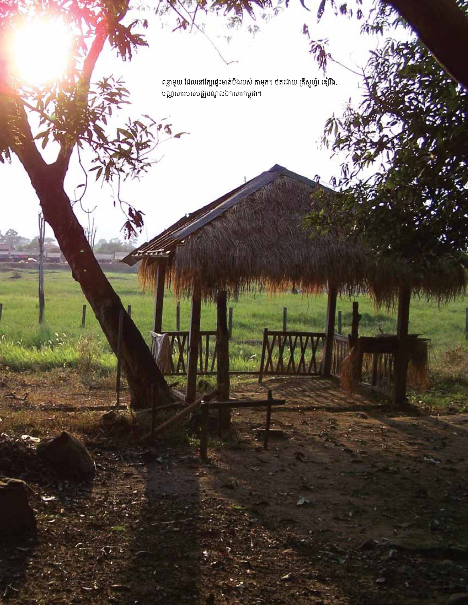
ពន្លាមួយ ដែលនៅក្បែរផ្ទះមាត់បឹងរបស់ តាម៉ុក។