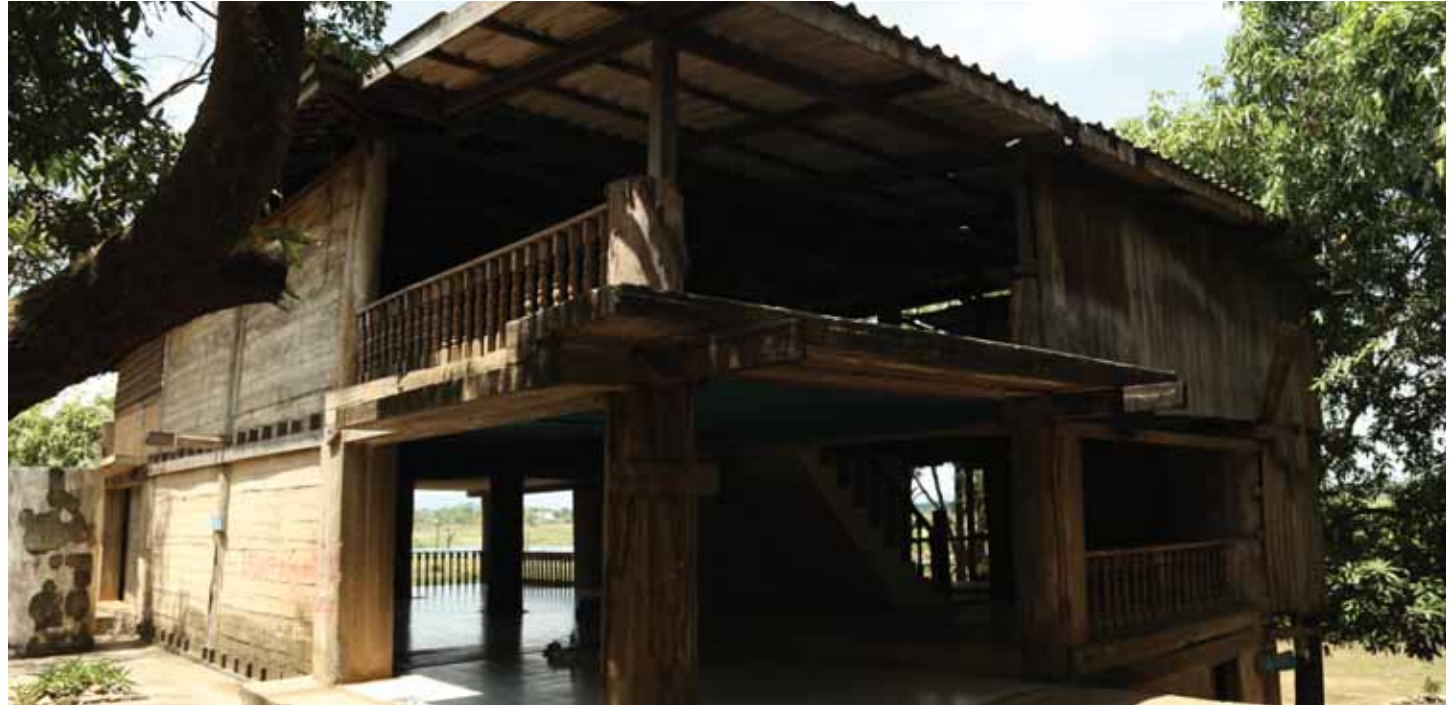
ផ្ទះតាម៉ុក ឬសារមន្ទីរតាម៉ុក បានសាងសង់បួនដំណាក់កាល។ ផ្ទះទីមួយសាងសង់ឡើងពីឈើ ប្រក់ហ្វីប្រឺស៊ីម៉ង់ត៍ និងក្រាលបេតុង ដោយប្រើប្រាស់ជាទីស្នាក់ការ កន្លែងចតរថយន្ត និងកន្លែងមើលការខុសត្រូវលើការដ្ឋានទំនប់អូរដឹក។ ផ្ទះទីពីរសាងសង់អស់រយៈពេលមួយឆ្នាំ រួចរាល់ក្នុងឆ្នាំ១៩៩៦ ជាកន្លែងស្នាក់នៅរបស់ តាម៉ុក។ ជាន់លើជាបន្ទប់គេង។ ជាន់កណ្តាលជាបន្ទប់ទទួលភ្ញៀវ មានរូបគំនូរប្រាសាទអង្គរវត្ត ប្រាសាទព្រះវិហារ និងផែនទីកម្ពុជាប្រជាធិបតេយ្យត្រូវលើជញ្ជាំង។ ជាន់ក្រោមជាកន្លែងសម្ងាត់ដែលមានតែ តាម៉ុក ម្នាក់គត់ដែលអាចចេញចូលបាន។ ផ្ទះទីបីមានទំហំធំជាងគេ ដោយប្រើប្រាស់ជាកន្លែងសម្រាករបស់ក្រុមគ្រួសារ តាម៉ុក និងប្រជាជនដែលតែងតែមកសូមជំនួយដូចជា អាហារ អង្ករ គោ និងបេសរបប្រើប្រាស់ផ្សេងៗពីតាម៉ុក។ ផ្ទះទីបួនជាចម្រៀនបាយ និងជាកន្លែងស្នាក់នៅសម្រាប់ចុងភៅ និងអ្នកបម្រើ។