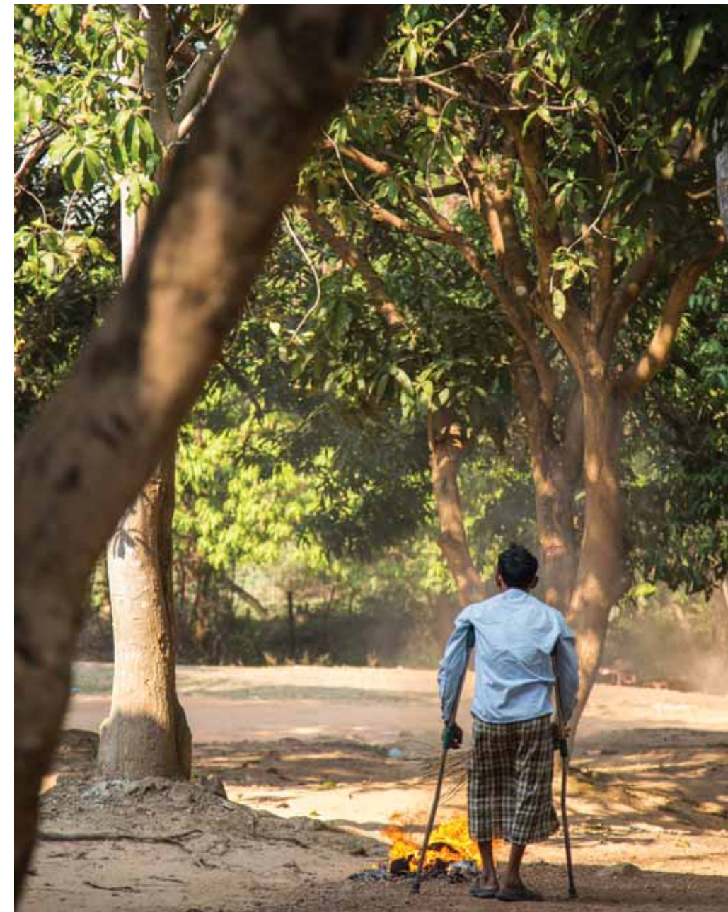
សន្តិសុខម្នាក់កំពុងតែឈរនៅក្នុងបរិវេណសារមន្ទីរតាម៉ុក ដែលជាទីតាំងដ៏ទាក់ទាញមួយសម្រាប់អ្នកមកទស្សនានៅសហគមន៍អន្លង់វែង។ នៅពេលអ្នកទស្សនាគិតអំពីអន្លង់វែង គេតែងតែគិតអំពីសារមន្ទីរក្បែរមាត់បឹងមួយនេះ។