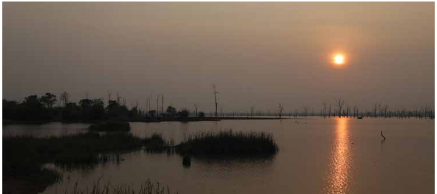
រូបភាពដែលបានថតនៅបឹងមួយហៅថា បឹងទំនប់ថ្មី។ បឹងទំនប់ថ្មីត្រូវបានស្គាល់ថា ជាបឹងសិប្បនិម្មិត និងបានសាងសង់ក្នុងសម័យកាលដែល តាមុក គ្រប់គ្រងអន្លង់វែង (១៩៨៩-១៩៩៨)។ ប្រជាជនក្នុងតំបន់យល់ឃើញថាបឹងនេះមានទំហំធំជាងបឹងអូរជីក និងមានសារៈសំខាន់ក្នុងការធ្វើកសិកម្មពេញមួយឆ្នាំនៅតំបន់ជុំវិញ។ ជាក់ស្តែងណាស់ ខ្មែរក្រហមផ្តល់តម្លៃឲ្យប្រព័ន្ធធារាសាស្ត្រយ៉ាងខ្លាំង ព្រោះខ្មែរក្រហមដឹងថានឹងផ្តល់សារប្រយោជន៍ដល់សហគមន៍ជាច្រើនជំនាន់ទៅមុខទៀត។ អ្វីដែលខ្មែរក្រហមមិនបានពិចារណានោះ គឺការបាត់បង់ជីវិតមនុស្ស និងភាពអមនុស្សធម៌ដែលកើតឡើងក្នុងការអនុវត្តគម្រោងនេះ។