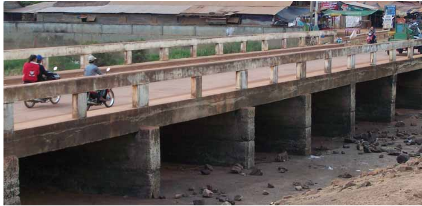
តាម៉ុក បានបញ្ចេញសាងសង់ស្ពាននៅឆ្នាំ១៩៩៥ ដោយប្រើប្រាស់គ្រឿងចក្រដែលនាំចូលពីប្រទេសថៃ ដើម្បីសម្របសម្រួលការធ្វើដំណើរទៅមករវាងស្រុកអន្លង់វែង និងប្រទេសថៃ។ ស្ពាននេះស្ថិតនៅតាមបណ្តោយផ្លូវទៅប៉ុស្តិ៍ត្រួតពិនិត្យជាសាណា ព្រំដែនខ្មែរ-ថៃ ។

ស្ពាន តាម៉ុក ឬ ស្ពានអូរជីក ត្រូវបានសាងសង់ឡើងនៅថ្ងៃទី១ ខែមករា ឆ្នាំ១៩៩៦។ ស្ពាននេះស្ថិតនៅក្នុងភូមិអូរជីក ឃុំអន្លង់វែង ស្រុកអន្លង់វែង ខេត្តឧត្តរមានជ័យ នៅតាមបណ្តោយផ្លូវពីអន្លង់វែងទៅព្រំដែនខ្មែរថៃ (ប្រកាសាណា)។ ស្ពានមានចម្ងាយ២០០ម៉ែត្រពីរង្វង់មូល ទីរួមស្រុកអន្លង់វែង។ ស្ពានត្រូវបានចំណាយអស់រយៈពេល២ឆ្នាំដើម្បីសាងសង់ ដោយប្រើគ្រឿងចក្រនិងបច្ចេកវិទ្យាប្រទេសថៃ។ មូលហេតុនៃ ការសាងសង់ស្ពានអូរជីកគឺដោយសារមានការលំបាកក្នុងការធ្វើដំណើរ និងដឹកជញ្ជូនវត្ថុផ្សេងៗ ដូចជាស្បៀងអាហារ និងគ្រាប់រំសេវកាត់អូរជីក នេះ។ ដូច្នេះ តាម៉ុកក៏បានរៀបចំសាងសង់ទំនប់ និងស្ពាននេះឡើង ដើម្បីសម្រួលដល់ការធ្វើចរាចរ។