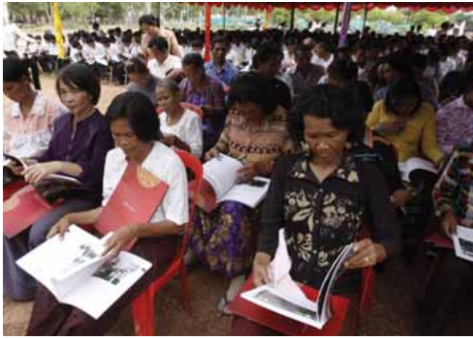
កម្មវិធីចែកសៀវភៅ «អំពីប្រវត្តិសាស្ត្រកម្ពុជាប្រជាធិបតេយ្យ (១៩៧៥-១៩៧៩) របស់មជ្ឈមណ្ឌលឯកសារកម្ពុជា ជូនដល់សិស្សានុសិស្ស គ្រូបង្រៀន និងសមាជិកសហគមន៍អន្លង់វែង ដែលប្រព្រឹត្តទៅនៅឆ្នាំ២០១២។