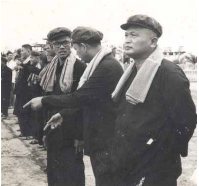
សមាជិកខ្មែរក្រហមជាន់ខ្ពស់កំពុងឈរជួរ ដើម្បីរង់ចាំភ្ញៀវភិក្ខិយស ប្រហែលជាឆ្នាំ ១៩៧៥។ ពីស្តាំទៅឆ្វេង៖ នួន ជា, អៀង សារី, សុន សេន, វន វ៉េត និង កុយ ធួន។

ប្រភពនៃចលនាខ្មែរក្រហម កើតចេញពីចលនាស៊ីប្រឆាំងនឹងអាណានិគមបារាំង។ នៅក្នុងត្រីមាសចុងក្រោយនៃសតវត្សរ៍ទី១៩ និងរហូតដល់ដើមទសវត្សរ៍ឆ្នាំ១៩៥០ បារាំងចាប់ផ្តើមគ្រប់គ្រងលើប្រទេសកម្ពុជា ឡាវ និងវៀតណាម។ ការគ្រប់គ្រងរបស់បារាំងទៅលើដែនដីអាណានិគម បានស្គាល់ជាទូទៅថាជាឥណ្ឌូចិនបារាំង។ ខណៈដែលទឹកចិត្តប្រឆាំងអាណានិគមកើតមានឡើងជានិច្ច ដែលពេលខ្លះផ្ទុះឡើងក្លាយជាឧទ្ទាមកម្មក្នុងរូបភាពណាមួយក៏ដោយ ក៏ចលនាប្រឆាំងអាណានិគម មិនបានសហការគ្នាឲ្យត្រឹមត្រូវទេ រហូតដល់ក្នុងទសវត្សរ៍ឆ្នាំ១៩៤០។ ចលនាខ្មែរឥស្សរៈ គឺជាចលនាប្រឆាំងបារាំង ចលនាអ្នកជាតិនិយមខ្មែរ បានកើតឡើងដោយមានការគាំទ្រពីប្រទេសថៃក្នុងឆ្នាំ១៩៤៥។ នៅពេលដែលយើងធ្វើការពិពណ៌នា ខ្មែរឥស្សរៈជាចលនាដែលគ្មានមេដឹកនាំគោលទេ។ តាមការពិតទៅ ចលនាខ្មែរឥស្សរៈបានបង្កើតឡើងពីសមាសភាពក្រុមផ្សេងៗគ្នាជាច្រើន ដែលមានរបៀបវារៈ និងគោលដៅនយោបាយផ្សេងៗគ្នា។ ក្រុមឥស្សរៈនៅភាគខាងលិចប្រទេសកម្ពុជា មាននិន្នាការដាក់ទៅរកការគាំទ្រពីប្រទេសថៃ ខណៈដែលក្រុមឥស្សរៈនៅភាគខាងកើតបានសហការ និងទទួលឥទ្ធិពលយ៉ាងខ្លាំងពីក្រុមកុម្មុយនីស្តវៀតណាម ដែលស្គាល់ថាជារៀតមិញ។ ក្រុមកុម្មុយនីស្តវៀតណាមបានដើរតួនាទីយ៉ាងសំខាន់ក្នុងការគាំទ្រឲ្យមានការកើតឡើងនូវចលនាកុម្មុយនីស្តកម្ពុជានៅក្នុងប្រវត្តិសាស្ត្រដំបូងរបស់ខ្លួន។