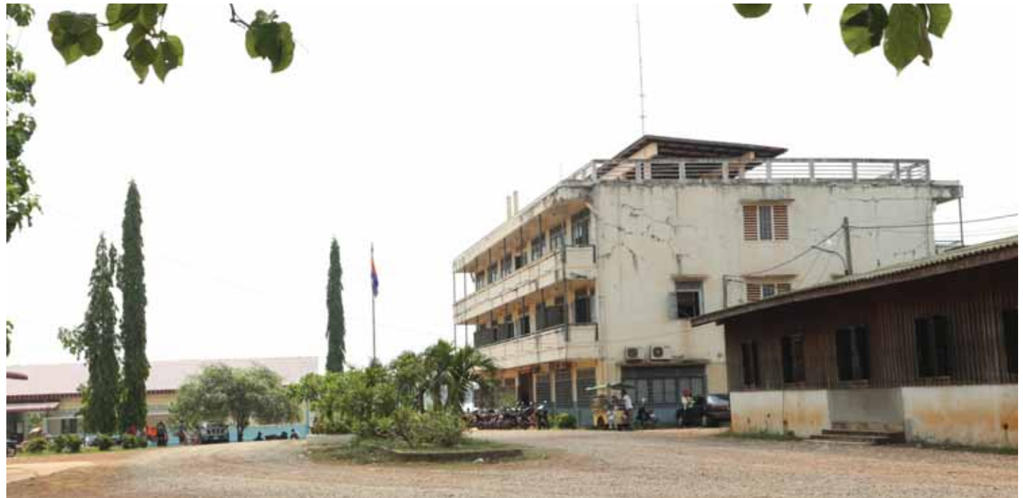
មន្ទីរពេទ្យតាម៉ុក សាងសង់នៅចុងឆ្នាំ១៩៩៣ មានកម្ពស់បីជាន់ ដើម្បីព្យាបាលប្រជាជន និងកងទ័ពខ្មែរក្រហមរូស។ ដោយសារតែអន្លង់វែងមានទីតាំងក្បែរតំបន់ព្រៃភ្នំ ជារឿយៗ ប្រជាជនតែងតែកើតជំងឺគ្រុនចាញ់។ តាលន ដែលបានសិក្សានៅប្រទេសចិន និង តាលាវ ជាមេដឹកនាំមកពីប្រទេសថៃ គឺជាអ្នកដែលគ្រប់គ្រងការសាងសង់អគារនេះ។ មន្ទីរពេទ្យនេះ ប្រើប្រាស់ជាមន្ទីរព្យាបាលអ្នកដែលមានបញ្ហាសុខភាពកម្រិតមធ្យម។ អ្នកជំងឺដែលមានសភាពធ្ងន់ត្រូវបញ្ជូនទៅព្យាបាលនៅប្រទេសថៃ។ សព្វថ្ងៃ មន្ទីរពេទ្យតាម៉ុក ជាមន្ទីរ ពេទ្យបង្អែកប្រចាំស្រុកអន្លង់វែង។ ប្រភពព័ត៌មាន៖ បណ្ណសាររបស់មជ្ឈមណ្ឌលឯកសារកម្ពុជា។