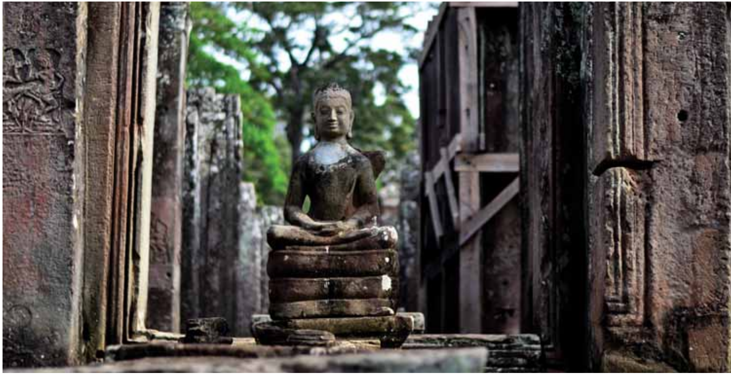
រូបចម្លាក់នៅប្រាសាទបាយ័ន។

អ្វីដែលគួរកត់សម្គាល់គឺ សាច់រឿងជាទស្សនៈ ដែលអាចនឹងមានភាពខុសគ្នា។ ហេតុនេះនៅពេលដែលយើងមើលសាច់រឿងយើងត្រូវតែគិតក្នុងចិត្តថា ទស្សនៈផ្សេងៗទៅលើព្រឹត្តិការណ៍ មនុស្ស និងកាលៈទេសៈ អាចនឹងមានភាពខុសពីគ្នា។ យើងបានធ្វើបទបង្ហាញអំពីសាច់រឿងដោយគិតពីទុកជាមុនថា នឹងមានទស្សនៈផ្សេងៗពីគ្នាទៅលើទិដ្ឋភាព ដែលអាចបង្ហាញមានការខ្វែងគំនិតគ្នានៃប្រវត្តិសាស្ត្រខ្មែរក្រហម និងសហគមន៍អន្លង់វែង។