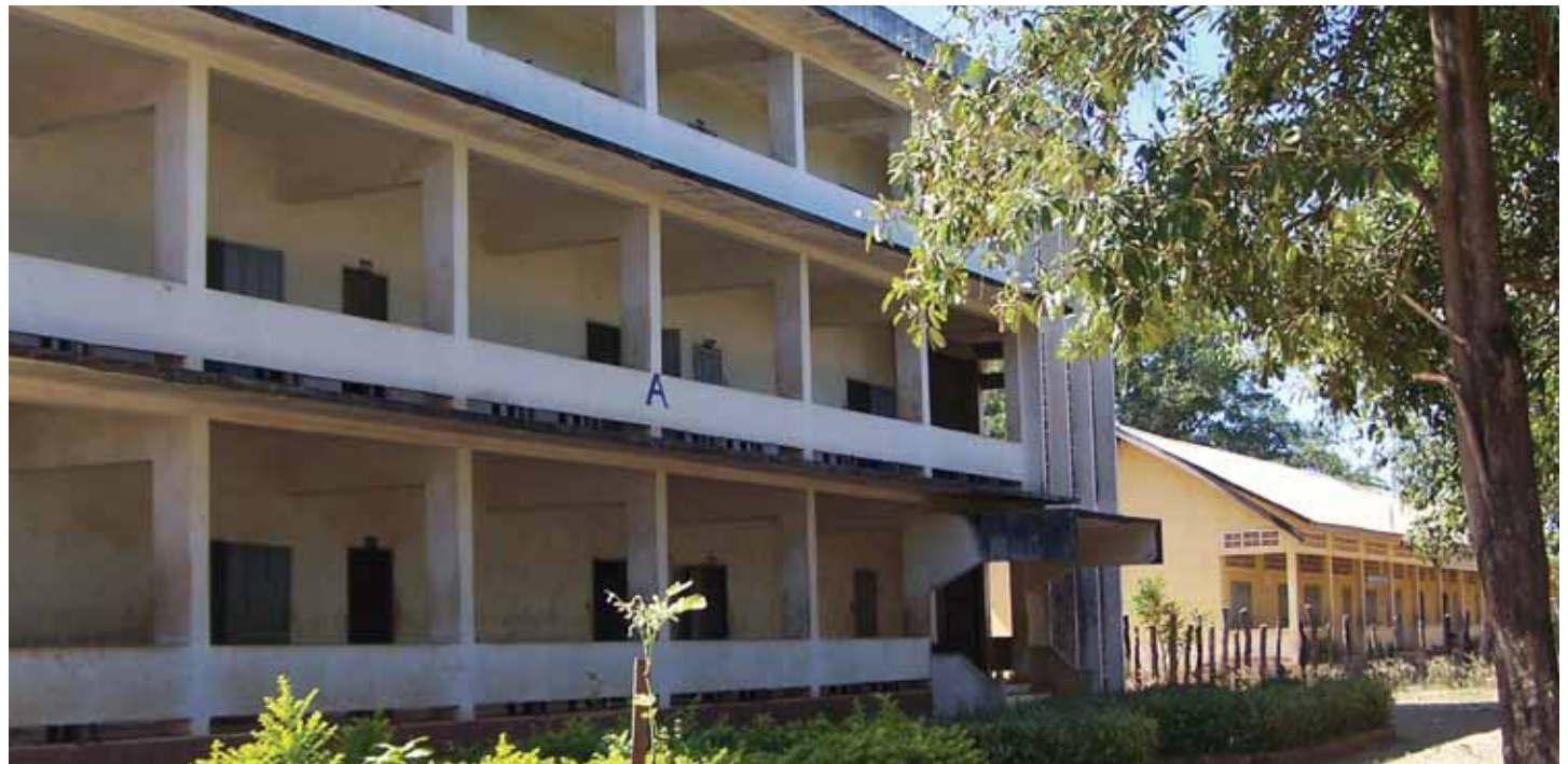
អគារកម្ពស់បីជាន់ មានដប់ពីរបន្ទប់ បានសាងសង់នៅឆ្នាំ១៩៩៣ អាចផ្ទុកសិស្សបានពី៣០០ទៅ៤០០នាក់។ កាលពីដំបូងឡើយអគារនេះជាសាលាបឋមសិក្សាសម្រាប់សិស្សថ្នាក់ ទី១ដល់ថ្នាក់ទី៥ ដោយរៀនតែគណិតវិទ្យា និងភាសាខ្មែរតែប៉ុណ្ណោះ។ សិស្សទាំងអស់ក៏ត្រូវរៀនអំពីសង្គ្រាមយួបរវាងវៀតណាម និងខ្មែរក្រហម។ សៀវភៅពុម្ព បិច សៀវភៅសរសេរ ដីស គ្នារខៀន និងសម្ភារសិក្សាផ្សេងៗគឺនាំចូលពីប្រទេសថៃ។ ក្រោយមកសាលានេះត្រូវបានពង្រីក សព្វថ្ងៃក្លាយជាវិទ្យាល័យអន្លង់វែង។