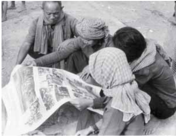
ជនរងគ្រោះនៃរបបខ្មែរក្រហមអានកាសែត នៅដើមទសវត្សរ៍១៩៨០។ ដោយសារជនរងគ្រោះភាគច្រើនមិនចេះអក្សរ កាសែតភាគច្រើនបោះពុម្ព ជាប្រភេទ បង្ហាញពីការដួលរលំនៃរបបខ្មែរក្រហម និងកិច្ចខំប្រឹងប្រែង របស់រដ្ឋាភិបាល ក្នុងការប្រយុទ្ធប្រឆាំងនឹងការត្រឡប់មកវិញនៃរបបខ្មែរ ក្រហម។ ប្រព័ន្ធផ្សព្វផ្សាយមានតួនាទីយ៉ាងសំខាន់ក្នុងការនាំសារពីរដ្ឋា ភិបាលនិងសមរក្សិមកជូនប្រជាជន។ ប្រភពព័ត៌មាន៖ បណ្ណសាររបស់ មជ្ឈមណ្ឌលឯកសារកម្ពុជា។

បេសកកម្មមួយរបស់មជ្ឈមណ្ឌលឯកសារកម្ពុជា គឺជាការលើកកម្ពស់ការអប់រំ ពីប្រវត្តិសាស្ត្រនៃអំពើប្រល័យពូជសាសន៍នៅកម្ពុជា និងផលប៉ះពាល់មកលើជីវិតប្រចាំថ្ងៃ។ គម្រោងស្តីពី «ការអប់រំអំពីប្រល័យពូជសាសន៍» គឺជាគម្រោងស្នូលមួយ របស់មជ្ឈមណ្ឌលឯកសារកម្ពុជា ធ្វើឡើងដំបូងមានការជាសះស្បើយយុត្តិធម៌ ការ ផ្សព្វផ្សាយ និងលទ្ធិប្រជាធិបតេយ្យ នៅក្នុងប្រទេសកម្ពុជា។ សៀវភៅគោលសំខាន់មួយ ដែលត្រូវបានប្រើប្រាស់ក្នុងគម្រោងមានចំណងជើងថា៖ «ប្រវត្តិសាស្ត្រកម្ពុជាប្រជា ធិបតេយ្យ (១៩៧៥-១៩៧៩)»។ សៀវភៅណែនាំសម្រាប់មគ្គុទ្ទេសក៍ទេសចរណ៍ សៀវភៅ «ប្រវត្តិសាស្ត្រកម្ពុជាប្រជាធិបតេយ្យ (១៩៧៥-១៩៧៩)» និងសៀវភៅ «ប្រវត្តិសាស្ត្រសហគមន៍អន្លង់វែង» គឺជាឯកសារគន្លឹះដើម្បីប្រើប្រាស់ក្នុងគម្រោងស្តីពី ការអប់រំអំពីប្រល័យពូជសាសន៍។