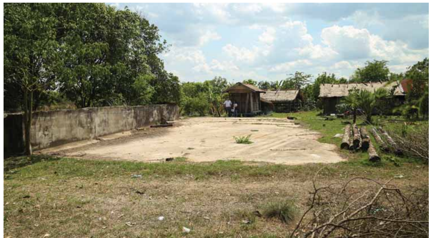
កន្លែងនេះត្រូវបានស្គាល់ថាជាទីតាំងការដ្ឋានដឹកជញ្ជូនរបស់ តាមុក ដែលបានសាងសង់នៅពាក់កណ្តាលឆ្នាំ១៩៩២ ជាឃ្នាំងកណ្តាលសម្រាប់ចែកចាយ ស្បៀង និងសម្ភារនានា។ កាលពីដើមឃ្នាំងនេះជាសាលាមួយ ដែលសាងសង់ពីលើនិងប្រក់ក្បឿង។