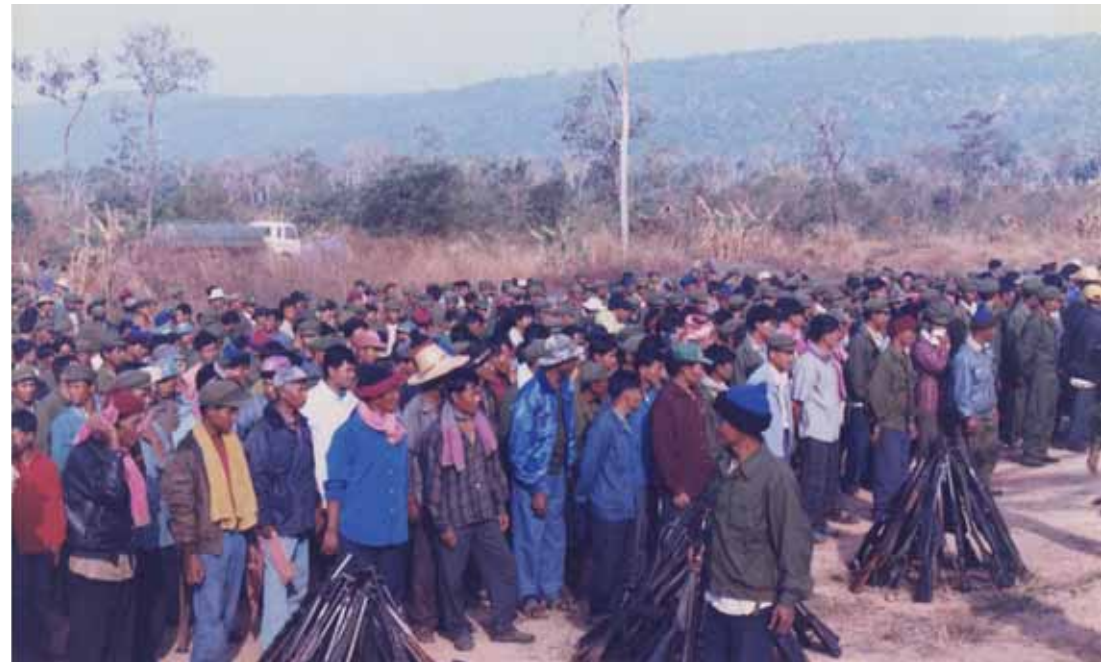
រូបខាងលើ៖ ពិធីសមាហរណកម្មនៅអន្លង់វែងឆ្នាំ១៩៩៩។ រូបខាងក្រោម៖ ពិធីសមាហរណកម្មនៅអន្លង់វែងឆ្នាំ១៩៩៩។

ផ្តល់ដំណឹងជាមុនយ៉ាងតិចតួចបំផុត។ អន្លង់វែងត្រូវបានដណ្តើមយកមកវិញអស់មួយរយៈពេលខ្លី ដែលបណ្តាលឲ្យខ្មែរក្រហម និងក្រុមគ្រួសារត្រូវ កៀសខ្លួនទៅកាន់ជម្រកជានានានៅតាមជួរភ្នំ។