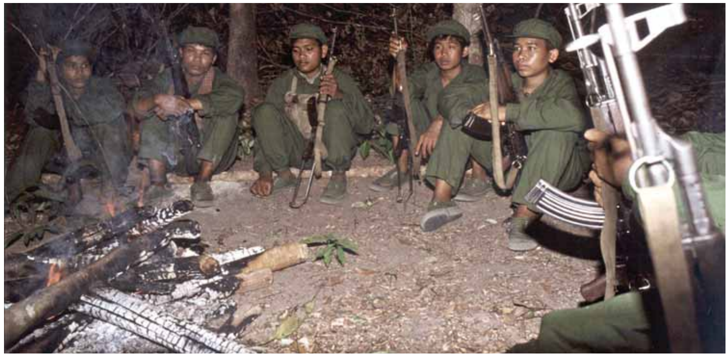
ក្រុមកងឈ្លបខ្មែរក្រហមនៅតំបន់គ្រប់គ្រងដោយខ្មែរក្រហមក្បែរព្រំដែនថៃ នៅឆ្នាំ១៩៨០។ ក្រុមឈ្លបខ្មែរក្រហមនេះត្រូវបានទទួលការគាំទ្រពីបរទេស ដែលជំនួយសេដ្ឋកិច្ចភាគច្រើនត្រូវបានផ្តល់ឲ្យដោយប្រទេសចិន។

សាច់រឿងទី១៖ នៅខែវិច្ឆិកា ឆ្នាំ១៩០៧ អាជ្ញាធរកម្ពុជាបានចាប់ខ្លួនចោរព្រៃម្នាក់ឈ្មោះ «អាឃួន» ដែលបានចូលរួមក្នុងសកម្មភាពប្លន់នៅតំបន់នោះ។ ឃួន បានគេចខ្លួនរួច បន្ទាប់ពីជាប់ឃុំឃាំងអស់រយៈពេលពីរបីថ្ងៃ។ ប៉ុន្តែ មុនពេលគេចខ្លួន ឃួន បានទទួលព័ត៌មានខ្លះៗអំពីក្រុមចោរព្រៃ ដោយបានបញ្ជាក់កាន់តែច្បាស់ពីការសង្ស័យរបស់អាជ្ញាធរបារាំង ទៅលើការជាប់ពាក់ព័ន្ធរបស់ប្រជាជនសៀមនៅក្នុងសកម្មភាពប្លន់។ ឃួន គឺជាជនជាតិខ្មែរដែលរស់នៅភូមិឆ្នងនៃខេត្តចុងកាល់។ កាលពីដើមខែតុលា ឆ្នាំ១៩០៨ ចោរព្រៃមួយក្រុមធំ (ប្រហែលជា៦០នាក់) បានចូលក្នុងភូមិរបស់គាត់ ដោយមានកាន់កាំភ្លើងវែងនិងដាវ។ មេចោរព្រៃបានបញ្ជាឲ្យកូនចៅចំនួន៣០នាក់ប្រមូលអ្នកភូមិ ហើយនាំអ្នកទាំងនោះទៅកាន់ឃុំកូល នៅសង់ភាក(សៀម)។ ឃួន ក៏ជាមនុស្សម្នាក់ក្នុងចំណោមអ្នកភូមិ ដែលត្រូវប្រមូលផ្តុំដែរ។ ចោរព្រៃបានដកហូត និងបំផ្លាញចោលប័ណ្ណបង់ពន្ធរបស់អ្នកភូមិ ដោយនិយាយថា ខ្លួននឹងមិនអនុញ្ញាតឲ្យអ្នកភូមិទាំងនោះរស់នៅក្រោមការគ្រប់គ្រងរបស់បារាំងឡើយ។ ចោរព្រៃបានព្យាយាមប្រមូលយកសត្វគោ និងសត្វចិញ្ចឹមដទៃទៀត។ ប៉ុន្តែក្រោយមក ចោរព្រៃយល់ឃើញថា ការធ្វើបែបនេះអាចធ្វើឲ្យយឺតដំណើររបស់ខ្លួន។ ចោរព្រៃបានបង្ខំឲ្យឃួនធ្វើជាអ្នកនាំផ្លូវ ដើម្បីវាយប្រហារភូមិដទៃទៀតនៅក្នុងប្រទេសកម្ពុជា។ ចោរព្រៃបានបញ្ជាឲ្យឃួននាំផ្លូវទៅកាន់ភូមិជុនឡក ដែលក្រុមចោរព្រៃបានធ្វើសកម្មភាពប្លន់។ ចោរព្រៃក៏បានប្លន់ភូមិតុងនិងខេត្តចុងកាល់ដែរ។ នៅក្នុងភូមិទាំងពីរនេះ មេចោរព្រៃបានបញ្ជាឲ្យកូនចៅ