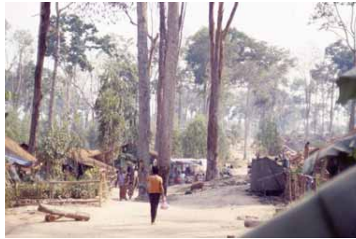
ជំរំសាយបី (Site B) នៅឆ្នាំ១៩៩៧។

ទាក់ទងនឹងរដ្ឋបាល តំបន់ដែលស្ថិតនៅជុំវិញអន្លង់វែងមានប្រវត្តិនៃការដណ្តើមការគ្រប់គ្រងគ្នាទៅវិញទៅមករវាងកម្ពុជា និងថៃ។ នៅចន្លោះឆ្នាំ១៨៦៧ និងឆ្នាំ១៩០៧ អន្លង់វែងស្ថិតនៅក្នុងអតីតខេត្តសៀមណាខនរបស់ថៃ ដែលតាំងពីមុនមក គឺស្ថិតនៅក្នុងប្រទេសកម្ពុជា។ នៅឆ្នាំ១៨៦៣ ប្រទេសកម្ពុជាស្ថិតនៅក្រោមការការពាររបស់បារាំង ក្នុងនាមជាអាណាព្យាបាលបែបអាណានិគម ដោយសារតែការដាក់សម្ពាធពីបារាំង សៀមបានប្រគល់ខេត្តបាត់ដំបង និងសៀមរាបមកឲ្យកម្ពុជាវិញ នៅឆ្នាំ១៩០៧។