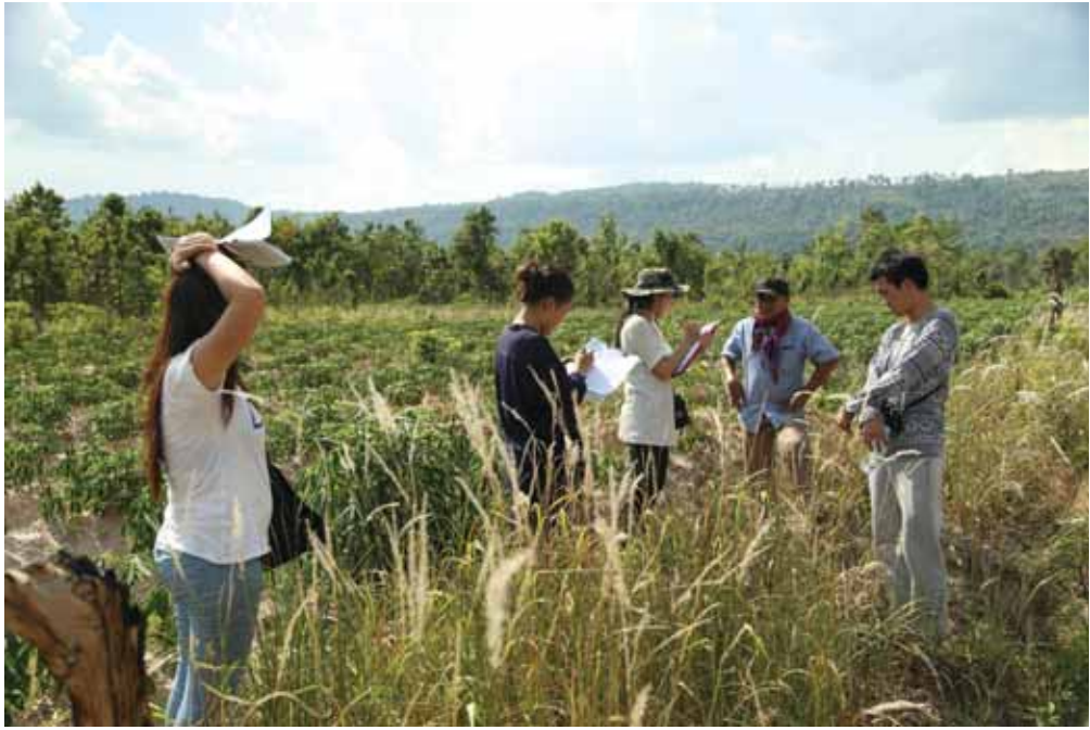
តាម៉ុក បានបង្កើតស្រែគំរូមួយឡើងនៅខែសីហា ឆ្នាំ១៩៩៤ ដែលគ្របដណ្តប់លើផ្ទៃដីជាង៤ហិកតា នៅក្នុងសហគមន៍ ត្រពាំងប្រើយ ស្រុកអន្លង់វែង។ ស្រែគំរូនេះធ្លាប់ជាអតីតកន្លែងលាក់ខ្លួនរបស់ ប៉ុល ពត និងមេដឹកនាំដទៃទៀត។

ស្រែគំរូស្ថិតនៅចម្ងាយ ១៣,៥ គីឡូម៉ែត្រពីរង្វង់មូលស្រុកអន្លង់វែង នៅ ក្នុងភូមិជើងភ្នំ ឃុំត្រពាំងប្រើយ ស្រុកអន្លង់ វែង ខេត្តឧត្តរមានជ័យ។ តាម៉ុក បាន បង្កើតស្រែគំរូឡើងនៅថ្ងៃទី១៧ ខែសីហា ឆ្នាំ១៩៩៤ នៅលើផ្ទៃដី ៤,៤១២ ហិកតា។ ដើមឡើយ ស្រែគំរូជាកន្លែងលាក់ខ្លួនរបស់ ប៉ុល ពត និងក្រុមមេដឹកនាំមួយចំនួនទៀត សម្រាប់រយៈពេលខ្លី ដោយមានផ្ទះចំនួន ៥ខ្នងសង់ នៅខាងក្រោមដើមឈើធំៗ។ មូលហេតុនៃការសាងសង់ផ្ទះទាំងនេះ គឺ ដោយសារមានការតាបសង្កត់ ពីប្រទេស ជិតខាង។ មានតែមេដឹកនាំខ្មែរក្រហម ជាន់ខ្ពស់ទេ ទើបស្គាល់ពីកន្លែងនេះ។ ក្រោយពេលដែល ប៉ុល ពត ចាកចេញពីផ្ទះ នេះ ទីតាំងទាំងមូលត្រូវបានប្រែក្លាយទៅជាទីវាលសម្រាប់ធ្វើស្រែចម្ការ ហៅថា «ស្រែគំរូ»។