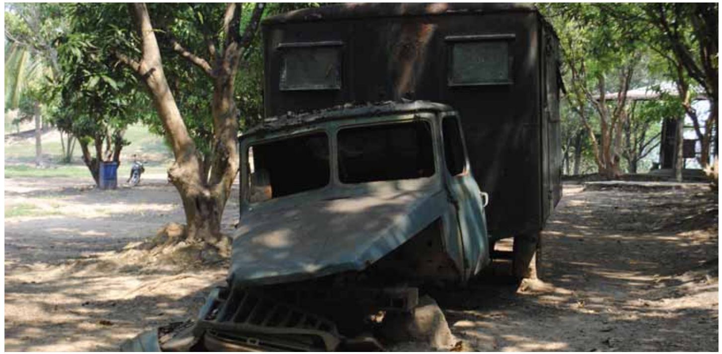
ថយន្តវិទ្យុចល័ត នៅក្បែរផ្ទះតាម៉ុក។