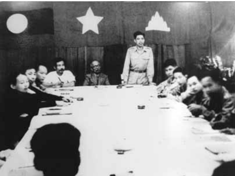
កិច្ចប្រជុំរវាងកុម្មុយនីស្តកម្ពុជា និងកុម្មុយនីស្តវៀតណាម។

នៅដើមឆ្នាំ១៩៧៣ ប្រហែល៨៥ភាគរយនៃទឹកដីកម្ពុជា បានធ្លាក់ក្នុងកណ្តាប់ដៃរបស់ខ្មែរក្រហម ហើយកងទ័ព លន់ នល់ ស្ទើរតែមិន អាចការពារខ្លួនបាន។ នៅថ្ងៃទី១៧ ខែមេសា ឆ្នាំ១៩៧៥ ខ្មែរក្រហមបានដណ្តើមកាន់កាប់ទីក្រុងភ្នំពេញ បន្តិចក្រោយមក បានប្រកាសពីការ បង្កើតរបបកម្ពុជាប្រជាធិបតេយ្យ។