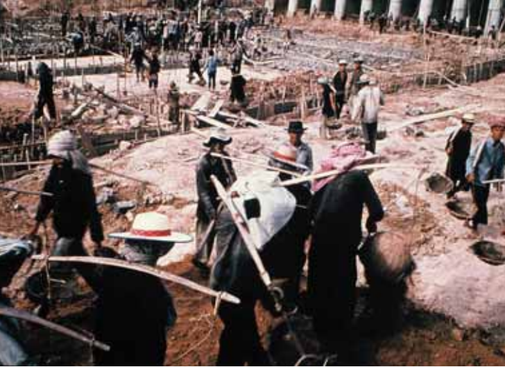
រូបភាពសហការណ៍មួយ។

ចាប់តាំងពីទសវត្សរ៍ឆ្នាំ១៩៧០ ជម្លោះជាបន្តបន្ទាប់បានកើតឡើងរវាងរៀតណាមកុម្មុយនីស្តនិងកម្ពុជាប្រជាធិបតេយ្យ ការប្រយុទ្ធនៃទ្រង់ទ្រាយធំបានផ្ទុះឡើងនៅក្នុងអំឡុងពាក់កណ្តាលឆ្នាំ១៩៧៧ នៅពេលដែលកងកម្លាំងខ្មែរក្រហមបានបាញ់ផ្លោង និងវាយប្រហារខេត្តមួយចំនួនរបស់រៀតណាម។ ដោយប្រឈមមុខនឹងការឈ្លានពានកាន់តែខ្លាំងឡើង រៀតណាមបានសម្រេចចិត្តវាយបកមកវិញ កងកម្លាំងកុម្មុយនីស្តរៀតណាម បានជ្រៀតចូលក្នុងតំបន់ជាច្រើនរបស់កម្ពុជាប្រជាធិបតេយ្យនៅឆ្នាំ១៩៧៧។ នៅត្រឹមខែមករា ឆ្នាំ១៩៧៨ កងកម្លាំងរៀតណាមបានដកថយ ប៉ុន្តែការលុកលុយបានបង្កឲ្យមានជម្លោះផ្ទៃក្នុងរវាងរបប ប៉ុល ពត និងភូមិភាគបូព៌ា ដែលមានព្រំដែនជាប់ប្រទេសរៀតណាម។ ដោយសារតែនកន្លែងមួយទៀតមានការសង្ស័យជ្រុល និងភ័យខ្លាចអំពីសកម្មភាពក្បត់ផ្លែក្នុង របប ប៉ុល ពត បានធ្វើសង្គ្រាមប្រឆាំងនឹងភូមិភាគបូព៌ារបស់កម្ពុជាប្រជាធិបតេយ្យ។ សង្គ្រាមនាំឲ្យមានការងើបឡើងប្រឆាំង ដោយមានការគាំទ្រពីរៀតណាម។ នៅខែមិថុនា ឆ្នាំ១៩៧៨ រៀតណាមបានចាប់ផ្តើមទម្លាក់គ្រាប់បែកមកលើកម្ពុជាប្រជាធិបតេយ្យ។ នៅខែតុលា ឆ្នាំ១៩៧៨ រៀតណាមបានចាប់ផ្តើមរៀបចំការវាយលុកទ្រង់ទ្រាយធំ។