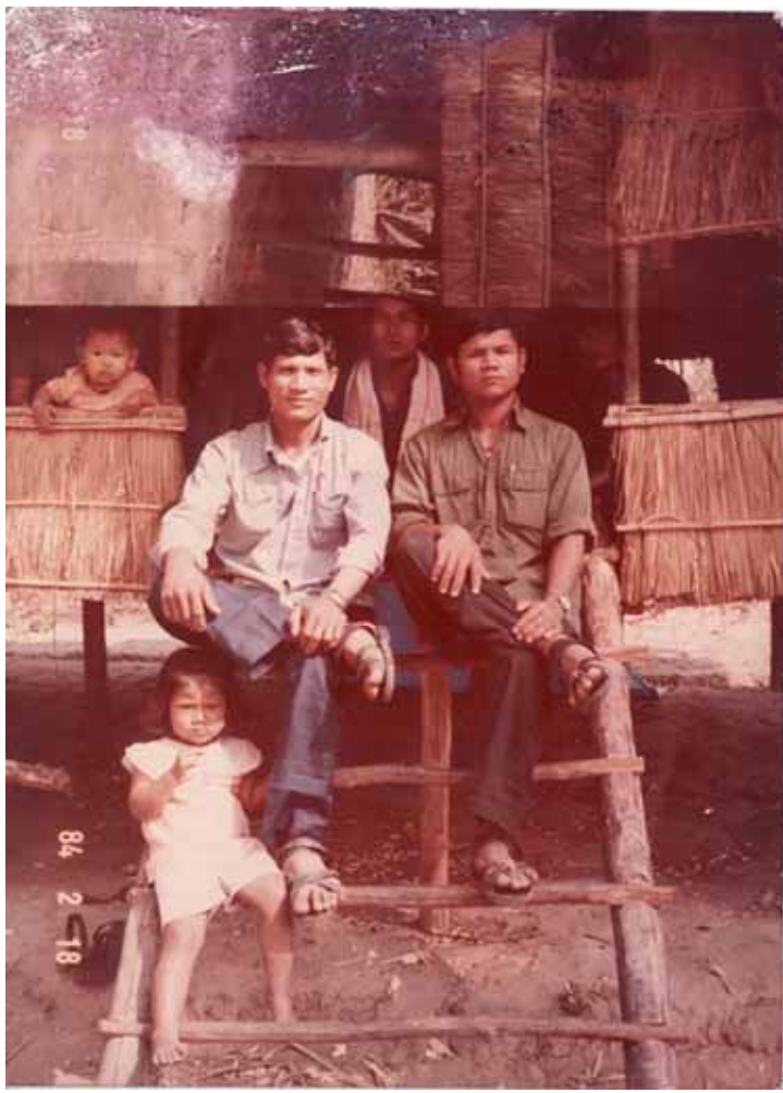
ក្រុមគ្រួសារខ្មែរក្រហមមួយ នៅក្នុងផ្ទះរបស់ខ្លួនក្នុងជម្ងឺមួយ នៅឆ្នាំ១៩៨៤។

នៅពេលរបបកម្ពុជាប្រជាធិបតេយ្យរលំនៅដើមឆ្នាំ១៩៧៩ ប្រជាជននៅអន្លង់វែងបានវិលត្រឡប់ទៅកាន់សហគមន៍របស់ខ្លួនវិញ។ ប្រជាជនបានប្រឈមមុខសាជាថ្មីជាមួយនឹងភាពលំបាក ដែលខ្លួនជាប់ផ្ទុះនៅចន្លោះកងកម្លាំងយោធាដែលប្រជែងគ្នាដើម្បីស្វែងរកការគាំទ្រ។ កង កម្លាំងខ្មែរក្រហមដែលបរាជ័យបានស្វែងរកទីជម្រកនៅលើភ្នំដងរែក ខណៈដែលកងកម្លាំងរបស់វៀតណាមនិងសាធារណរដ្ឋប្រជាមានិតកម្ពុជា បានកាន់កាប់តំបន់អន្លង់វែង។