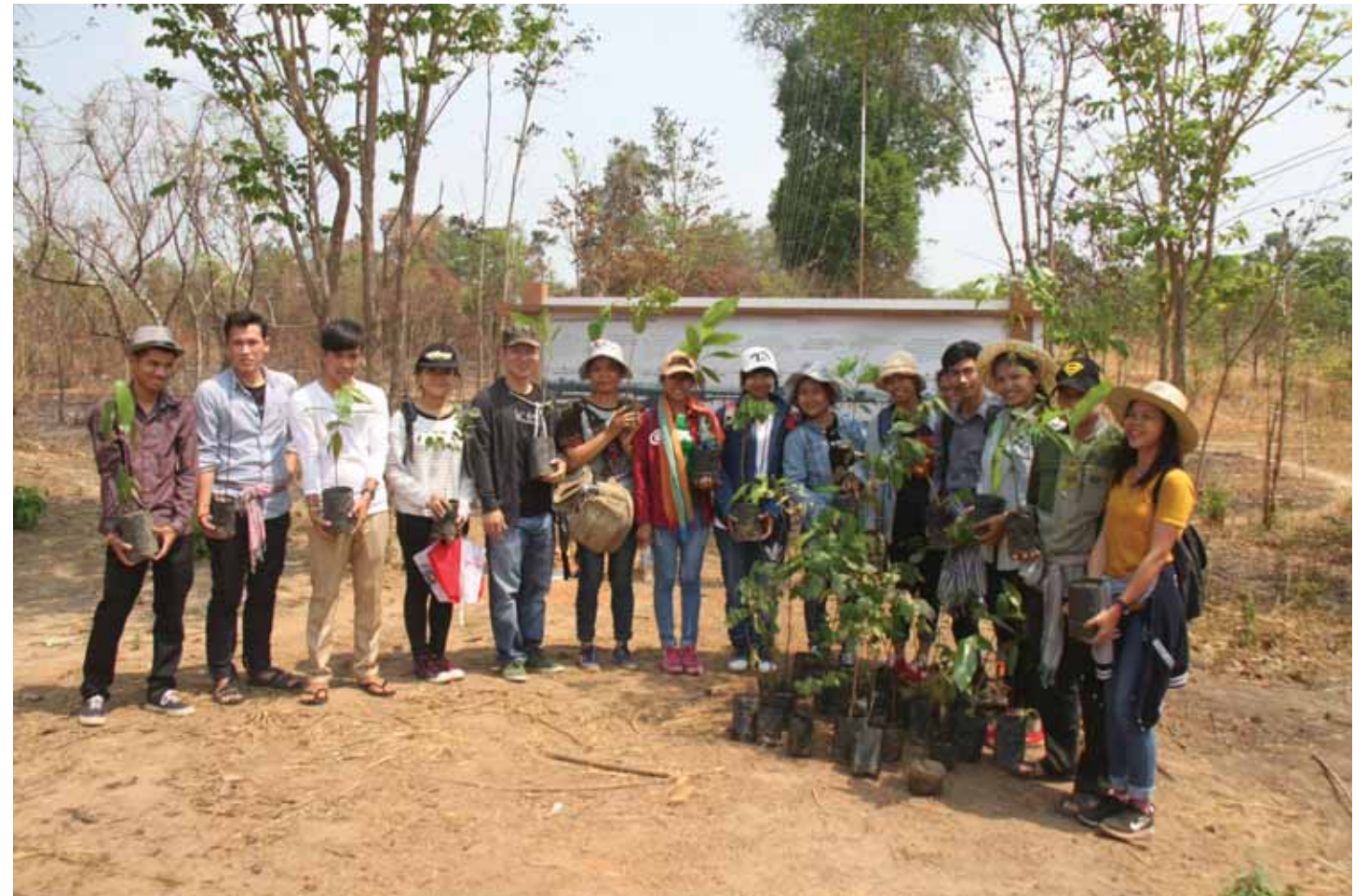
ចាប់តាំងពីសម្ពោធនៅឆ្នាំ២០១៤មក មជ្ឈមណ្ឌលសន្តិភាពអន្លង់វែង តែងតែបានរួមបញ្ចូលនូវការពិចារណាអំពីបរិស្ថានទៅក្នុងផែនការយុទ្ធសាស្ត្រ និងសកម្មភាពរបស់ខ្លួន។ មកដល់ថ្ងៃនេះ បុគ្គលិករបស់មជ្ឈមណ្ឌលបានចំណាយពេលវេលាជាច្រើន ក្នុងការដាំដើមឈើដើម្បីស្តារព្រៃទឹកភ្លៀងក្នុងសហគមន៍ ក៏ដូចជាក្នុងតំបន់ដែលកំពុងតែជួបប្រទះការថយចុះនៃព្រៃឈើ។ តាំងពីការចាប់ផ្តើមរបស់គម្រោងនេះមក មានសិស្សចំនួនជាងមួយរយនាក់មក ដែលបានស្ម័គ្រចិត្តជាមួយនិងបុគ្គលិករបស់មជ្ឈមណ្ឌល ដើម្បីដាំកូនឈើលើបរិវេណរបស់មជ្ឈមណ្ឌលសន្តិភាពអន្លង់វែងដែលមានទំហំ៣ហិកតា។ សិស្សស្ម័គ្រចិត្តទាំងនោះ ក៏បានចូលរួមកម្មវិធីទស្សនកិច្ចសន្តិភាពរបស់មជ្ឈមណ្ឌល។ ក្នុងឆ្នាំ២០១៦ មានដើមឈើសរុបចំនួន១១០០ដើមត្រូវបានដាំនៅតាមសាលារៀននិងវត្តអារាមនានា។