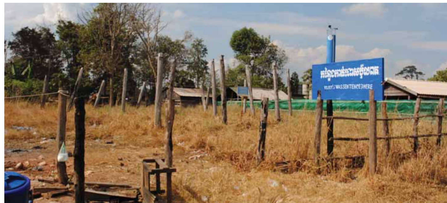
សសរបាក់បែកដែលជាសំណល់នៃរោងប្រើប្រាស់ការកាត់ទោស ប៉ុល ពត។ រោងនោះមានតែដំបូល និងសសរតែប៉ុណ្ណោះគ្មានជញ្ជាំងទេ ដែលពីមុនគឺជាចំណតរថយន្ត និងជាកន្លែងសម្រាករបស់ប្រជាជនពេលធ្វើដំណើរចេញចូលប្រទេសថៃ។ នៅទីនេះ តាម៉ុក កាត់ទោសឲ្យ ប៉ុល ពត ជាប់ឃុំអស់មួយជីវិត ដោយមូលហេតុចម្បងគឺពីបទសម្លាប់ សុន សេន និងគ្រួសារ មុនការកាត់ទោសរយៈពេលមួយខែ។ សព្វថ្ងៃនេះ នៅសល់តែសសរទេ ដំបូលខូចបាត់អស់ និងមានទីតាំងស្ថិតនៅក្បែរព្រំដែនថៃ ហើយក៏ជានិមិត្តរូបនៃយុត្តិធម៌សម្រាប់ក្រុមគ្រួសារ សុន សេន ដែលបានបាត់បង់ជីវិតដោយស្នាដៃ ប៉ុល ពត។ អ្នកភូមិដែលចូលរួមសវនាការក្នុងតុលាការប្រជាជន ធ្វើឡើងនៅចុងខែមីនា ឆ្នាំ១៩៩៧ បាននាំគ្នាហៅ ប៉ុល ពត ថាជនក្បត់។ មន្ត្រី និងមេទ័ពខ្មែរក្រហមមួយចំនួនដែលចូលរួមក្នុងការកាត់ទោសនេះរួមមាន ខឹម ង៉ុន, ចាន់ យ៉ូរ៉ាន់ និង ទេព យុនណាល់។ ក្រោយមក ទេព យុនណាល់ បានរៀបការជាមួយប្រពន្ធ ប៉ុល ពត។ ប្រភពព័ត៌មាន៖ បណ្ណសាររបស់មជ្ឈមណ្ឌលឯកសារកម្ពុជា។