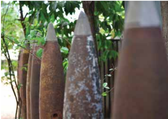
យុទ្ធកណ្ណមិនទាន់ផ្ទុះ ដែលត្រូវបានរកឃើញនៅតំបន់ជនបទ។