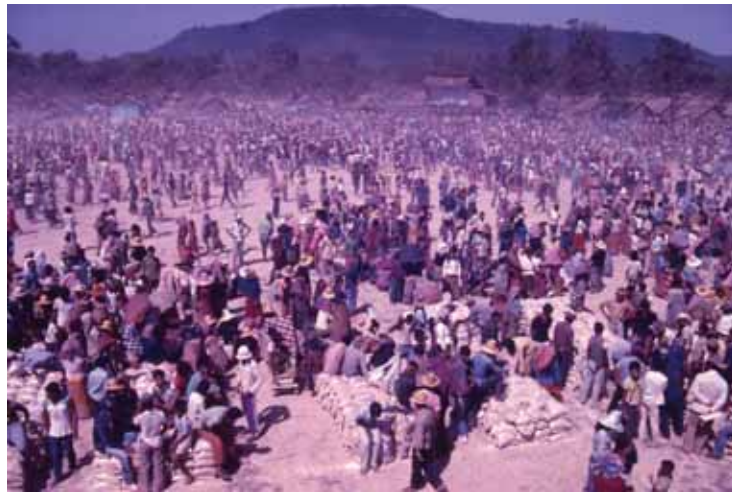
ជនភៀសខ្លួនកម្ពុជានៅជំនាន់ដំបូង ប្រទេសថៃ កំពុងប្រមូលផ្តុំគ្នាទៅកន្លែងចែកអាហារ នៅទសវត្សរ៍ឆ្នាំ១៩៨០។

ស្រុកអន្លង់វែង បង្កើតឡើងជាយូរណាស់មកហើយ មុនពេលក្លាយជាតំបន់ស្ថិតនៅក្រោយនៃចលនាកម្ពុជានិរតី នៅប្រទេសកម្ពុជា។ ឆ្នាំ១៩០៧ អ្នកគូរផែនទីបារាំងបានស្គាល់សហគមន៍អន្លង់វែង នៅពេលបង្កើតព្រំដែនប្រទេសកម្ពុជាជាមួយប្រទេសជិតខាងនៅភាគខាងជើង។ មានការជឿថា ដូចសហគមន៍ដទៃទៀតដែលបង្កើតឡើងនៅតាមព្រំដែនថៃ ប្រជាជនខ្មែរដែលធ្វើដំណើរមកពីភាគខាងលើនៃប្រទេសសៀម ឬមកពីខេត្តស៊ីសាកេតដែលសព្វថ្ងៃជាខេត្តរបស់ថៃ បានចូលមកតាំងទីលំនៅក្នុងស្រុកអន្លង់វែង។