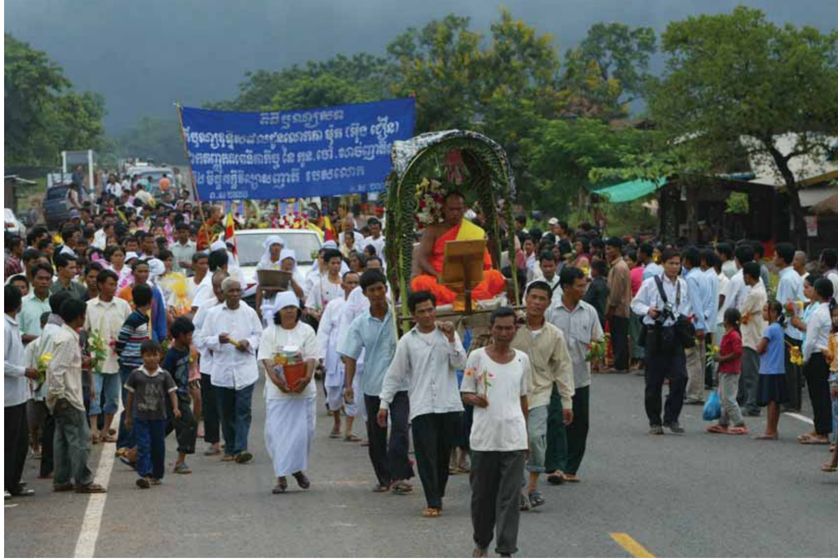
រូបខាងលើ៖ កូនដង្ហែបុណ្យសពរបស់ តាម៉ុក នៅឆ្នាំ២០០៦។ រូបខាងស្តាំ៖ ចេតិយរបស់ តាម៉ុក នៅអន្លង់វែង។

ការណែនាំ៖ អ្នកតម្រូវឲ្យមានដៃគូម្នាក់ក្នុងការធ្វើសកម្មភាព។ នៅពេលដែលអ្នកមានដៃគូ ម្នាក់ក្នុងចំណោមអ្នកទាំងពីរត្រូវបើកសៀវភៅម្នាក់ទៀតបិទសៀវភៅ។ អ្នកដែលបើកសៀវភៅត្រូវជ្រើសរើសទីតាំងប្រវត្តិសាស្ត្រមួយកន្លែង ប្រាប់ឈ្មោះទីតាំងទៅកាន់អ្នកដែលបិទសៀវភៅ។ អ្នកដែលបិទសៀវភៅត្រូវនិយាយរៀបរាប់ពីព័ត៌មានទាំងឡាយ ដែលខ្លួនបានដឹងស្តីពីទីតាំងប្រវត្តិសាស្ត្រ។ អ្នកបើកសៀវភៅអាចបន្ថែម ឬកែតម្រូវព័ត៌មានដែលខ្លះខាត។ ផ្លាស់ប្តូរវេនគ្នាក្នុងការអនុវត្តរហូតដល់បានអនុវត្តលើគ្រប់ទីតាំងប្រវត្តិសាស្ត្រ។