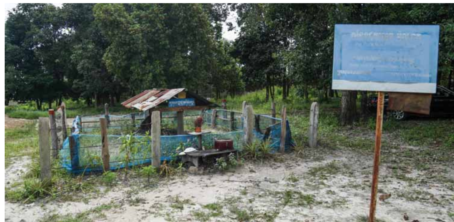
សាកសពរបស់ ប៉ុល ពត ត្រូវបានបូជានៅទីកន្លែងនេះ ក្នុងខែមេសា ឆ្នាំ១៩៩៨ មានទីតាំងស្ថិតនៅបណ្តោយផ្លូវជាតិលេខ៦៧ ក្បែរព្រំដែនកម្ពុជា-ថៃ និងមានចម្ងាយ១៣គីឡូម៉ែត្រពីរង្វង់មូលអន្លង់វែង។ ប៉ុល ពត ស្លាប់ដោយជំងឺបេះដូងក្នុងពេលជាប់ឃុំ។ នៅខែមីនា ឆ្នាំ១៩៩៧ តាម៉ុក កាត់ទោសឲ្យ ប៉ុល ពត ជាប់ឃុំអស់មួយជីវិត ដោយចោទពីបទសម្លាប់ សុន សេន និងគ្រួសារ។ សាកសព ប៉ុល ពត បូជានៅថ្ងៃទី១៧ ខែមេសា ឆ្នាំ១៩៩៨ ដែលត្រូវជាខួបលើកទី២៣នៃការទទួលជ័យជម្នះរបស់ខ្មែរក្រហមលើរបប លន់ នល់។ ពីដំបូងរហូត ប៉ុល ពត មិនបានរៀបចំឲ្យជិតដល់ទេ ហើយយកកង់ឡាន និងសំរាម ប្រើប្រាស់សម្រាប់ធ្វើជាមឃូស និងបូជាសព។ ប្រភពព័ត៌មាន៖ បណ្ណសាររបស់មជ្ឈមណ្ឌលឯកសារកម្ពុជា។