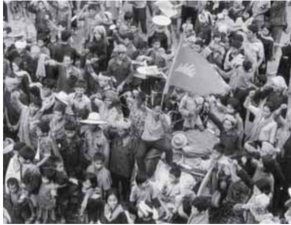
អ្នកភូមិមួយចំនួនជួបជុំគ្នាដើម្បីពិភាក្សាអំពីព្រឹត្តិប្រតិបត្តិកងកម្លាំងរណសិរ្ស នៅឆ្នាំ១៩៨២ ដែលមានរៀបរាប់ពីបទឧក្រិដ្ឋរបស់ ប៉ុល ពត។

ចាប់តាំងពីឆ្នាំ១៩៧៩ ដល់ឆ្នាំ១៩៨៩ កងកម្លាំងខ្មែរក្រហមនិងប្រជាជន ដែលស្ថិតក្រោមការគ្រប់គ្រងរបស់ខ្មែរក្រហម រស់នៅក្នុងមូលដ្ឋានយោធាខ្មែរក្រហម នៅតាមបណ្តោយព្រំដែនកម្ពុជា-ថៃ ឬក្នុងជំរុំជនភៀសខ្លួនដទៃទៀតនៅប្រទេសថៃ។ មូលដ្ឋានយោធាខ្មែរក្រហមចម្បងចំនួនពីរ ដែលជាសម្ព័ន្ធជាមួយតំបន់អន្លង់វែង គឺ ភ្នំ១០០១ និងភ្នំ១០០៣ ដែលមានទីតាំងនៅតាមបណ្តោយជួរភ្នំដងវែក ភាគខាងជើង និងភាគពាយ័ព្យនៃព្រំដែនកម្ពុជា-ថៃ ហើយជាទីតាំងដ៏ពិសេសសម្រាប់ការការពារព្រំ ខ្នង និងការកសាងកម្លាំងប្រយុទ្ធឡើងវិញ។