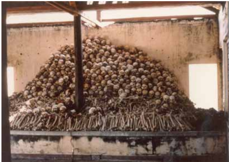
គំនរលាងក្បាល និងឆ្អឹងមនុស្ស ក្នុងគុកសង់ ស្រុកកណ្តាលស្ទឹង ខេត្តកណ្តាល។ មុនសម័យខ្មែរក្រហមទីនេះ គឺជាមជ្ឈមណ្ឌលបណ្តុះបណ្តាលគ្រូបង្រៀន។ ក្រោយមក ខ្មែរក្រហមបានប្រែក្លាយទៅជាមន្ទីរឃុំឃាំង។ នៅចុងទសវត្សរ៍ឆ្នាំ១៩៨០ ចេតិយមួយសាងសង់នៅទីនេះដើម្បីដាក់អង្គធាតុអ្នកស្លាប់នៅរបបខ្មែរក្រហម។

ការណែនាំ៖ អ្នកត្រូវការដៃគូម្នាក់។ ដំបូង អ្នកនិងដៃគូគួរតែអានសេចក្តីសង្ខេបប្រវត្តិសាស្ត្រឡើងវិញ ដើម្បីរំលឹកការចងចាំ។ បន្ទាប់ពីអ្នកទាំងពីរបានអានសេចក្តីសង្ខេបរួច សូមបិទសៀវភៅ និងយកក្រដាសមួយសន្លឹកចេញមកក្រៅ។ អ្នកទាំងពីរត្រូវផ្លាស់វេនគ្នា ដើម្បីធ្វើបទបង្ហាញពីសេចក្តីសង្ខេបយ៉ាងខ្លី ( មិនលើសពី៥នាទី ) អំពីប្រវត្តិសាស្ត្រខាងលើ។ នៅពេលដែលម្នាក់កំពុងធ្វើបទបង្ហាញ ម្នាក់ទៀតគួរកត់ត្រានៅលើក្រដាសដាច់ដោយឡែកមួយ។ អ្នកដែលធ្វើបទបង្ហាញគួរតែនិយាយតាមធម្មតា ប៉ុន្តែមិនលឿនពេក ដើម្បីទុកឲ្យម្នាក់ទៀតធ្វើការកត់ត្រា។ អ្នកកត់ត្រាគួរតែព្យាយាមសរសេរឲ្យបានច្រើនតាមដែលអាចធ្វើបាន និងសរសេរចំណុចទាំងឡាយណា ដែលអ្នកធ្វើបទបង្ហាញគួរលើកមកនិយាយ ក៏ប៉ុន្តែប្រហែលជាបានភ្លេច។ អ្នកកត់ត្រាក៏អាចសរសេរនូវការអង្កេតទាំងឡាយដូចជា តើអ្នកធ្វើបទបង្ហាញបាននិយាយអ្វីដែលមិនត្រឹមត្រូវ និងអាចយល់បានឬទេ។ សកម្មភាពទី៣ មានវត្តបំណងពីរយ៉ាងគឺ ( ១ ) អាចជួយអ្នកធ្វើបទបង្ហាញ អនុវត្តជំនាញធ្វើបទបង្ហាញជាមួយនឹងព័ត៌មានប្រវត្តិសាស្ត្រ និង ( ២ ) អាចជួយអ្នកកត់ត្រាឲ្យអនុវត្តជំនាញវាយតម្លៃ ដោយសារតែអ្នកចូលរួមអាចនឹងត្រូវវាយតម្លៃអ្នកផ្សេងទៀត នៅក្នុងពេលធ្វើបទបង្ហាញនាពេលអនាគត។