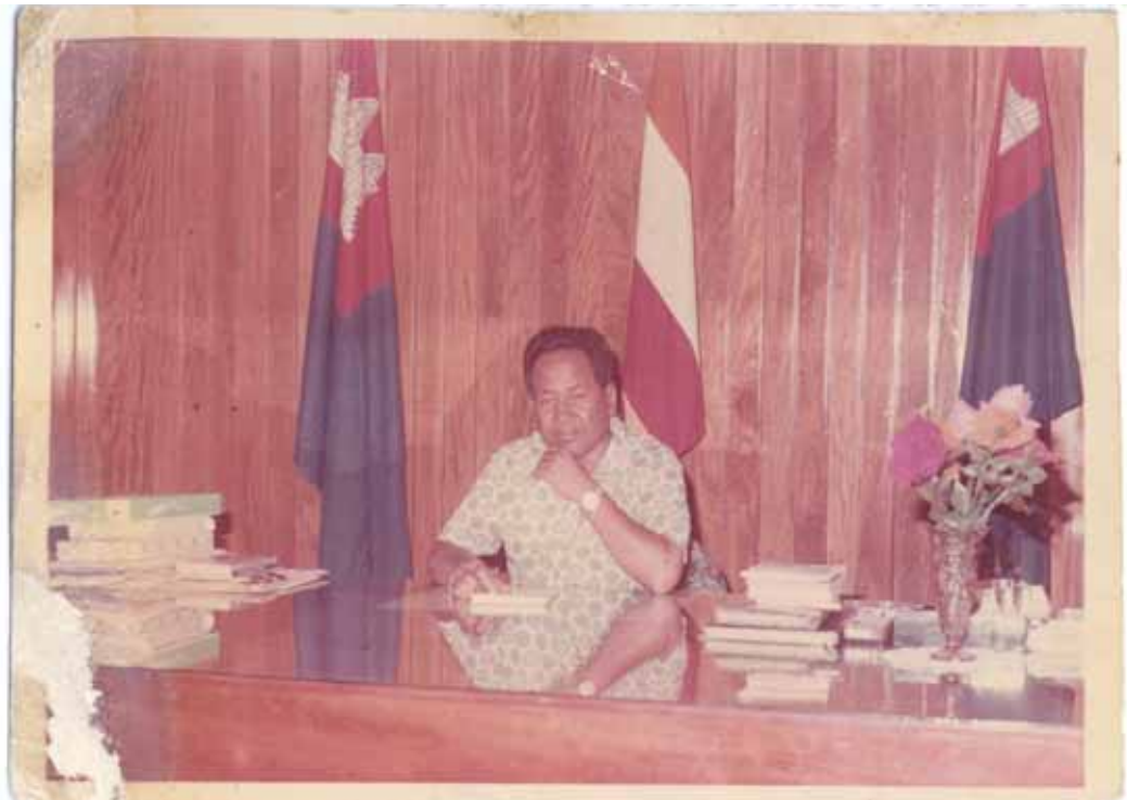
មន្ត្រីនៃរបបសាធារណរដ្ឋខ្មែរ កំពុងអង្គុយក្នុងការិយាល័យ។