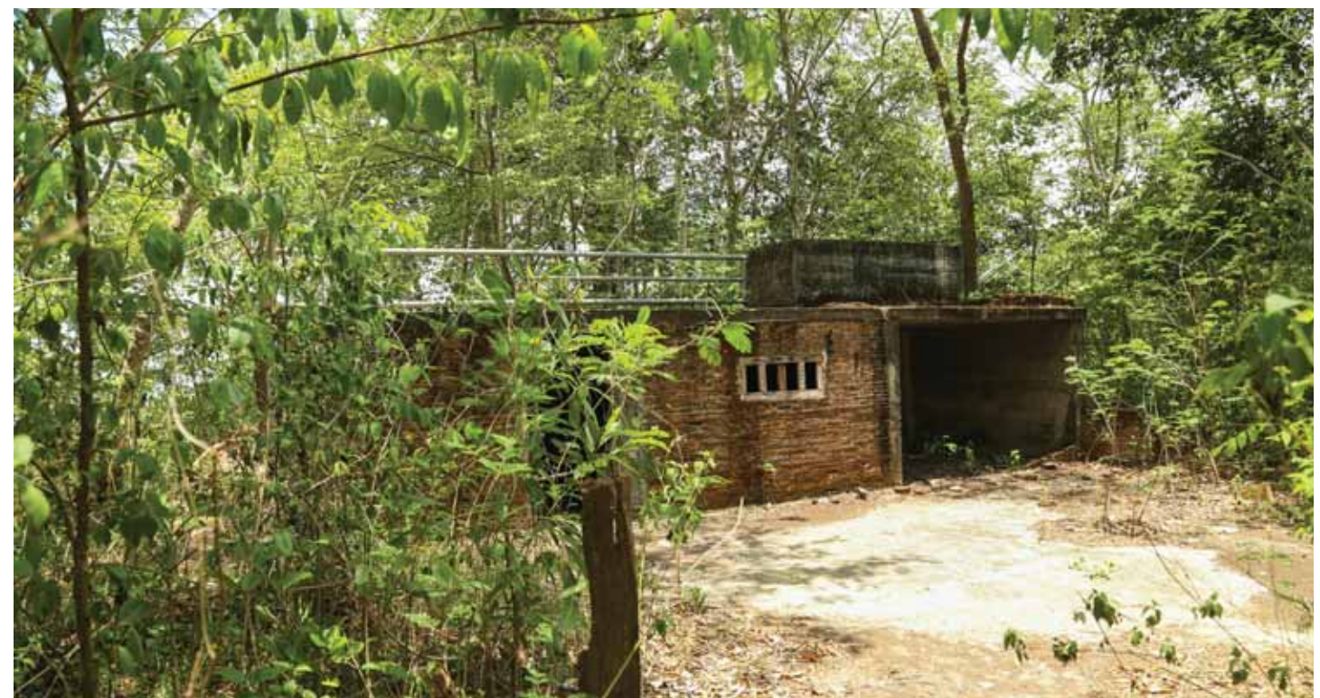
អគីតផ្ទះ ប៉ុល ពត និងខៀវ សំផន ដែលស្ថិតនៅចម្ងាយ ២៤គីឡូម៉ែត្រពីរង្វង់មូលដ្ឋានស្រុកអន្លង់វែង។ ផ្ទះនោះត្រូវបានសាងសង់ឡើងនៅឆ្នាំ១៩៩៣ ពីស៊ីម៉ង់ត៍និងឥដ្ឋ ដែលមានដំបូល ស៊ីម៉ង់ត៍។ ផ្ទះនោះក៏មានជាន់ក្រោមដីដែលអាចប្រើប្រាស់ជាឃ្នាំងដាក់វត្ថុមានតម្លៃនិងជាកន្លែងលាក់ខ្លួន។ មានការរាយការណ៍ថា តាម្នាក់ បានសាងសង់ផ្ទះនេះឲ្យ ប៉ុល ពត និង ខៀវ សំផន នៅក្រោយពេលដែលអ្នកទាំងពីរបានរៀបចំស្នូលប៉ៃលិនមកអន្លង់វែង។