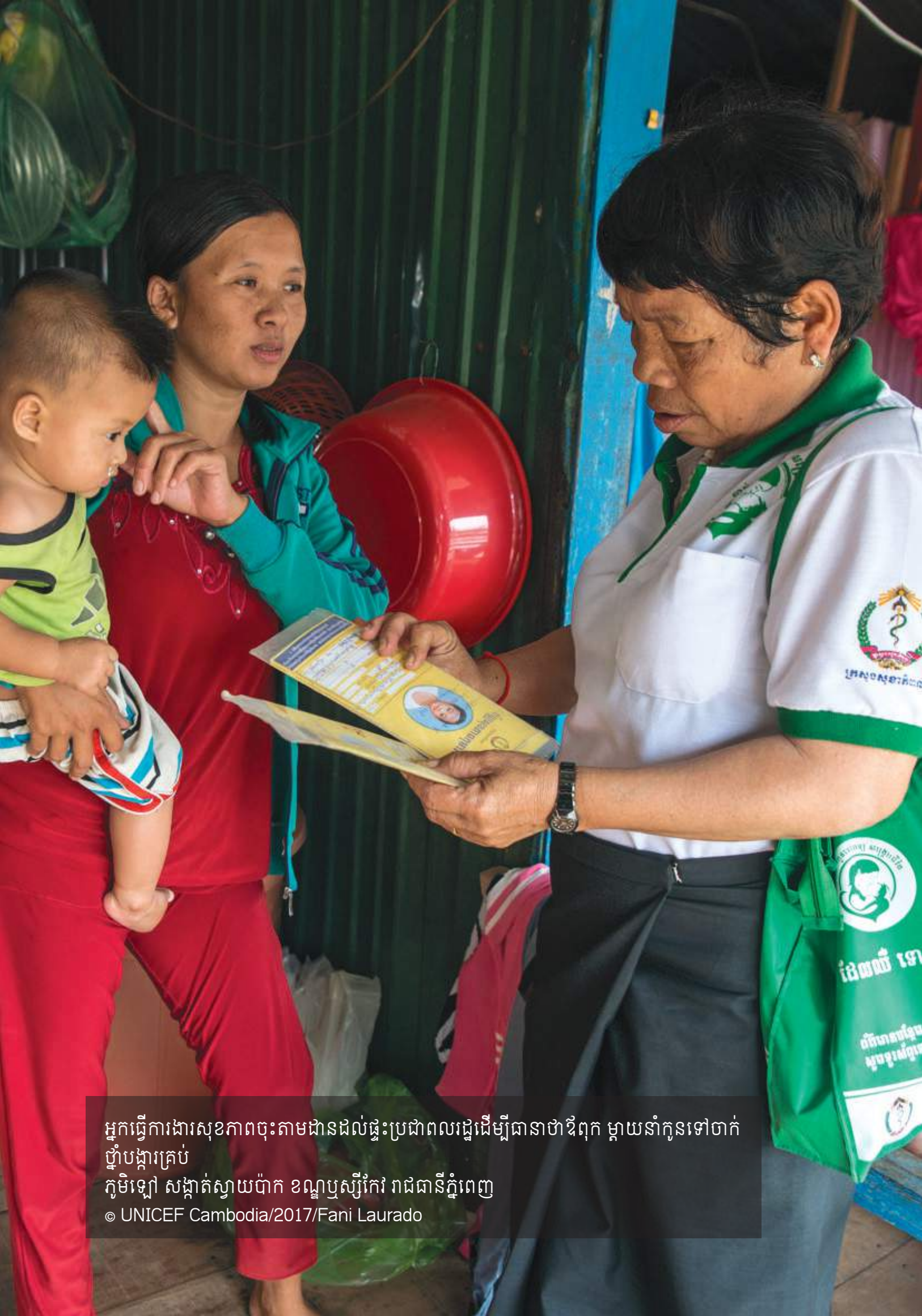
អ្នកធ្វើការងារសុខភាពចុះតាមដានដល់ផ្ទះប្រជាពលរដ្ឋដើម្បីធានាថាឪពុក ម្តាយនាំកូនទៅចាក់ ថ្នាំបង្ការគ្រប់ ភូមិឡៅ សង្កាត់ស្វាយប៉ាក ខណ្ឌបួស្សីកែវ រាជធានីភ្នំពេញ