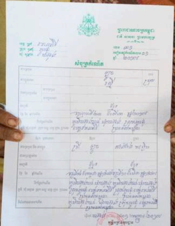
ម្តាយពរទារកមានសំបុត្រកំណើត ភូមិចាម្បងចាន់ ឃុំចាម្បង ស្រុកអូរជុំ ខេត្តរតនគិរី