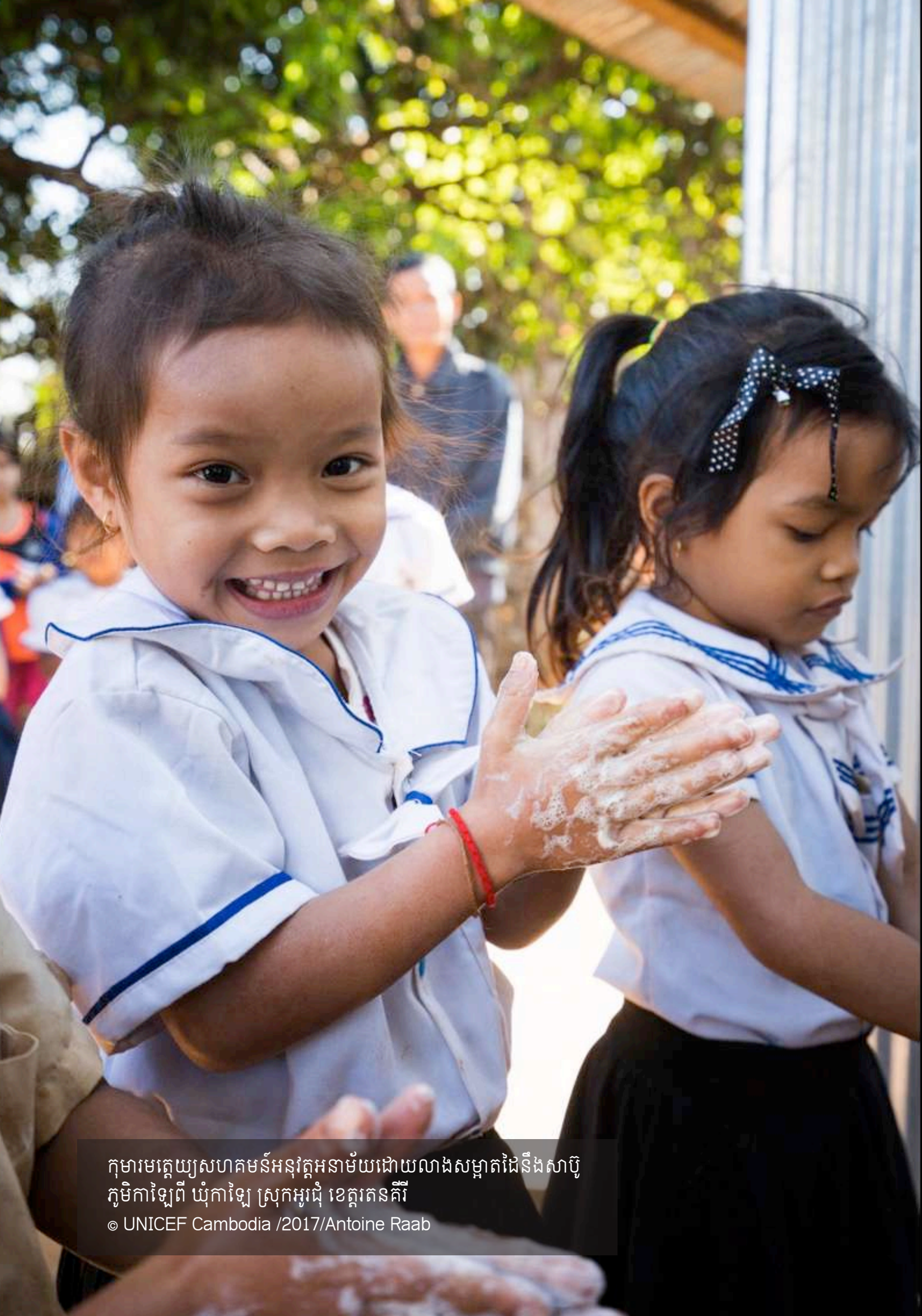
កុមារមត្តេយ្យសហគមន៍អនុវត្តអនាម័យដោយលាងសម្អាតដៃនឹងសាប៊ូ ភូមិកាឡេពី ឃុំកាឡេ ស្រុកអូរជុំ ខេត្តរតនគិរី