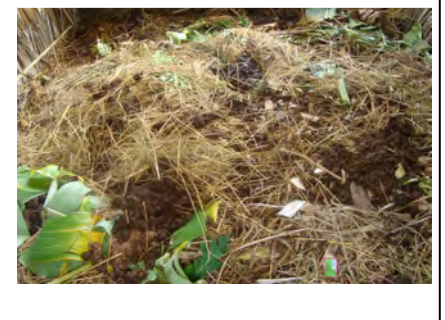
រោងជីកំប៉ុស្តិ៍បងស្រី ង៉ែត ធឿន

បងស្រី ង៉ែត ចាន់ធឿន ជាកសិករម្នាក់មានអាយុ ៣៧ឆ្នាំ មានគ្រួសារ និងកូនប្រុស៣នាក់ ស្រី២នាក់រស់ នៅភូមិតូច ឃុំក្រាំងស្នាយ ស្រុកឈូក ខេត្តកំពត ។ គាត់បាននិយាយថាគម្រោងបណ្តុះបណ្តាលពីបច្ចេកទេសធ្វើ ជីកំប៉ុស្តិ៍នេះ មានសារៈសំខាន់ណាស់ ព្រោះគាត់បានទទួលចំណេះដឹង ជំនាញសម្រាប់គាត់ ក៏ដូចជាកសិកររស់នៅ ក្នុងភូមិដែលបានចូលរួមវគ្គ បណ្តុះបណ្តាលនេះដែរ ។ គាត់បញ្ជាក់ថា៖ ឥឡូវខ្ញុំមិនចំណាយប្រាក់កាស ច្រើនដូចពេលមុនក្នុងការទិញជីគីមីទៀតទេ អ្នកជិតខាងហាក់ដូចជាមិន ទាន់ជឿថាស្រូវរបស់គាត់ល្អ ដោយសារប្រើជីកំប៉ុស្តិ៍ទេ ហើយទទួលបាន ផលច្រើនជាងពេលមុន ( សម្រាប់ស្រែ២ ស្លឹកកើន៣០ថាង ទៅ៥០ថាង) ជាងនេះទៅទៀតគាត់បានសង្កេតឃើញថាជីស្រែរបស់គាត់ដ៏ធូរស្រួលស្អុ ងមានដុះស្មៅក្នុងស្រែ អង្ករល្អ "ភ្លឺដូចភ្លឺង" ហយឆ្មារៀងមានសុខភាពល្អ ជាងមុន ហើយជីវភាពក៏ប្រសើរឡើងគ្រាន់បើ ព្រោះហូបគ្រប់គ្រាន់បាន ១តោនដែរសម្រាប់ឆ្នាំនេះ ។ ជាការផ្លាស់ប្តូរមួយទៀតសម្រាប់គ្រួសារ គាត់បន្ទាប់ពីចូលរួម សកម្មភាពគម្រោងគីមីស្នាត មិនមានសំរាម ឬ លាមកសត្វនៅពាសវាលពាសកាល ព្រោះឥឡូវគាត់មានរោងជីកំប៉ុស្តិ៍ ។ ជាចុងបញ្ចប់គាត់បង្ហាញពីការប្តេជ្ញាចិត្តក្នុងការបន្តសកម្មភាព បច្ចេកទេស ធ្វើជីធម្មជាតិបន្តទៀត ទោះបីគម្រោងត្រូវបញ្ចប់ក៏ដោយ តែទោះជាណាង ណាក៏ការសន្សំជីមិនបានគ្រប់តាមតម្រូវការនៃទំហំស្រែ ឡើយ ជាហេតុធ្វើឱ្យ គាត់ចំណាយថវិកា បន្ថែមទិញជីគីមីដើម្បីបង្រប់ ( មុនទិញ៣បារ/ឆ្នាំ តែ ឥឡូវទិញ១បារ/ឆ្នាំ) ។