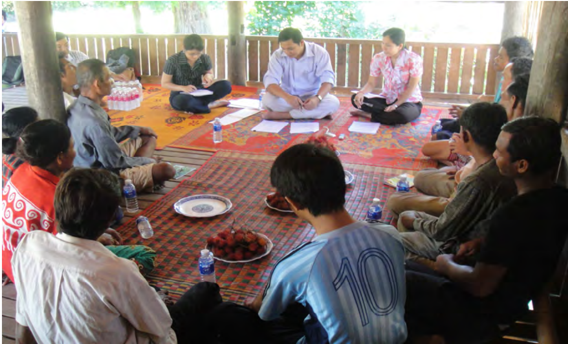
ក្រុមពិភាក្សាវគ្គបច្ចេកទេសដំណាំបន្លែ ភូមិអង្គប្រាង្គរ ឃុំ សន្លុង ស្រុកទ្រាំង ខេត្តតាកែវ ថ្ងៃទី ២០ កក្កដា ២០១០